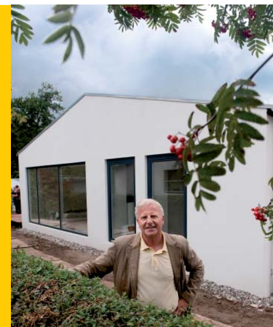
Det kan lade sig gøre: Som led i energirenovering af tre villaer til passivhus-standard, har byggefirmaet Parvenu og bjerg arkitektur tidligere præsenteret et 124 kvm. stort typehus fra 1966 på Brorsonsvej 6 i Hjørring, der tidligere var en renoveringstrængende og energitung privatbolig.

Som en ekstra gevinst ved en større udbredelse af bygningintegreret energiproduktion kan det nævnes, at alle erfaringer viser, at ejere af VE-anlæg udviser langt større motivation til at gennemføre energibesparende tiltag i såvel deres bygning som i deres adfærd.